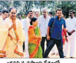
అరవల్లి వ్యవసాయ క్షేత్రంలో కేసీఆర్ దంపతులు