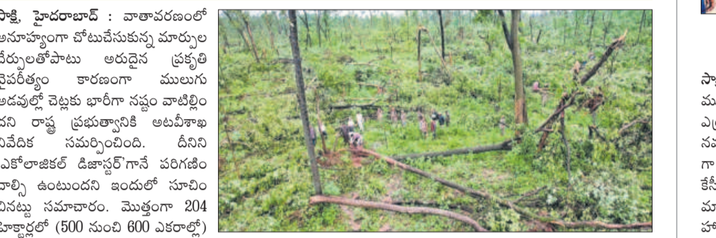
సాక్షి, హైదరాబాద్ : వాతావరణంలో అనూహ్యంగా వోటుచేసుకున్న మార్పుల వేరులతోపాటు అరుదైన ప్రకృతి వైపరీత్యం కారణంగా ములుగు అడవుల్లో చెట్లకు భారీగా నష్టం వాటిల్లింది. దీనిని 'ఎకోలాజికల్ డిజాస్టర్'గానే పరిగణించాలి అంటుంది ఐఎండీ. సూర్యుని చిన్న నవచారం. మొత్తంగా 204 హెక్టార్లలో (500 నుంచి 600 ఎకరాల్లో) దాదాపు 70 వేల దాకా వివిధ జాతుల చెట్లకు నష్టం వాటిల్లినట్లు పేర్కొంది. అటవీ పునరుద్ధరణలోపాటు, భూసార పరిరక్షణ చర్యలు, గ్యాస్ ఎర్లడైన చోట్ల వాటిని నింపేలా పెద్దమొత్తంలో మొక్కల పెంపకం, వంటివి చేపట్టాల్సి ఉంటుందని స్పష్టం చేసింది. ఈ ప్రాంతంలో ఇంకా అడవిపడడం వరాలు కురుస్తుండడంతోపాటు, కొండ ప్రాంతాలు వంటివి ఉండడంతో జరిగిన నష్టం, కూచిన చెట్ల వివరాల సేకరణ అంత వేగంగా సాగడం లేదని అటవీ అధికారులు చెబుతున్నారు. వివిధ రూపాల్లో వాటిల్లిన నష్టంపై వారంతోజుట్టే క్షేత్రస్థాయి నుంచి ఒక స్పష్టమైన అంచనాకు వచ్చాక పర్యావరణం, అడవులలో సంబంధమున్న నిపుణులతో అధ్యయనం జరిపించాలని అటవీశాఖ నిర్ణయించింది. దేశంలోనే అత్యంత అరుదైన రీతిలో ములుగు అటవీప్రాంతంలో చెట్లకు నష్టం జరిగినందున, పూర్తి సమాచారం అందిన తర్వాత అటవీ ఉన్నతాధికారులు డిజిటి వెళ్లి కేంద్ర ప్రభుత్వానికి నివేదించిన నివేదిక అండ్ ఇండియన్ స్టేట్స్ విద్యంసంపై సమాచారం. ములుగులో సుడిగాలుల బీభత్సం సమయంలోనే అడిరాబాద్ జిల్లా ఉమ్మడి మహబూబ్ నగర్ పరిధిలోనూ స్వల్పస్థాయిలో చెట్లకు నష్టం జరిగినట్లు అటవీ అధికారులు గుర్తించారు.

వాతావరణంలో అనూహ్య మార్పులతోనే భారీ నష్టం ములుగు అటవీ విద్యంసంపై రాష్ట్ర ప్రభుత్వానికి నివేదిక అందజేసిన అటవీశాఖ వివరాలపై చేతులెత్తిన ఐఎండీ, ఇక ఎన్ఆర్ఎస్సీపైనే ఆశ