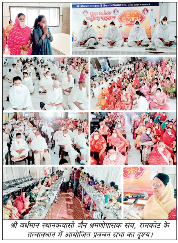
श्री वर्धमान स्थानकवासी जैन श्रमगोपासक संघ, रामकोट के तत्वावधान में आयोजित प्रवचन सभा का दृश्य।